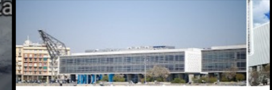
EDEM Escuela de Empresarios 4,4 ★★★★★ (170) ⓘ Universidad · 🚶 Abierto · Cierra a las 21:00