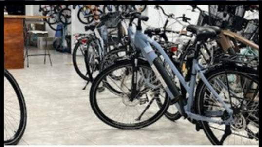
Santa Marcelita Bikes | Alquiler Y Reparación De Bicicletas Y Patinetes En Valencia