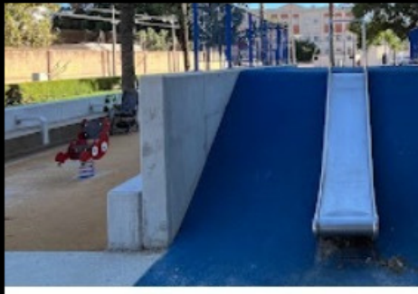
Parc de Joaqui