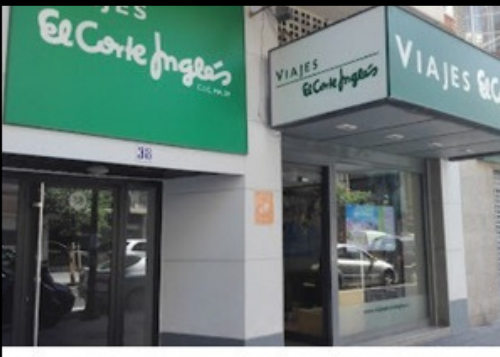
Viajes El Corte Inglés - Valencia Reina