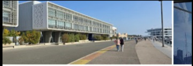
Lanzadera 4,6 ★★★★★ (401) ⓘ Centro de negocios · 🚶 Abierto 24 horas